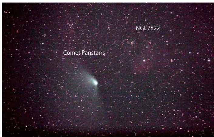
with FS-60CB & Canon EOS X3 using LPS-V2 (4 composites)

今年は、2大彗星の年と言われ、パンスタース (Panstarrs) 彗星がその1つであった。