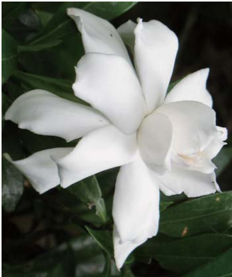
コクチナシ Gardenia augusta 松山市内にて

“ヒメクチナシ”とも呼ばれ、6～7月頃に咲く白い八重の花で、クチナシを小さくしたようであり、高さ20cmくらいの低木です。花は純白で、咲いた後は比較的早く茶色に枯れますが、周辺に次々と新しいきれいな花が咲き、香りもあり、長く楽しめます。写真は八重の花ですが、満開に近いもので、間もなく中心部が開花し、黄色いおしべが見えるようになります。純白の花弁と背景の濃緑色で厚みのあるしっかりした葉の対照が見事で、花が浮き出たように際だって見られます。果実は薬用で、消炎・止血の効能があるとされています。日常の生活空間を探すと案外どこかで見つかる可憐な花です。