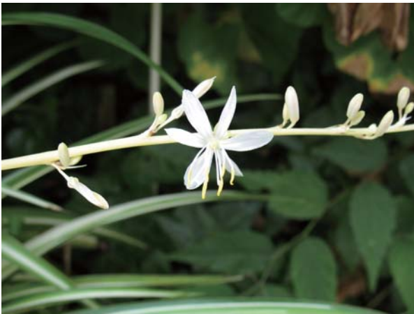
オリヅルラン(折鶴蘭) Chlorophytum comosum

普通によく見る植物で、春先に長いランナーを勢よく四方に出して次々に花が咲き、そこからまた葉や根が出て、次々に新しい子株ができる。油断すると隣の鉢にも簡単にランナーを介して根を張り侵入し、そこを占拠する事態にもなる。極めて繁殖力の強い植物である。葉は流線型で長く、葉の両側や中央に斑入りのものがあるが、写真の花では葉の中央に斑が見られる。葉が緑一色の突然変異株も見られる。年中楽しめる見ていてまことに気持ちの良い元気の出る観葉植物であり、花も楽しめる。白い6枚の花弁を有し、大きさは1cmもないくらいの小さな白い可憐な花である。ランと名がついているが、ユリ科の常緑多年草で、原産地は南アフリカ。(写真・文/大脇祐治)