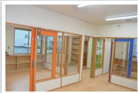
「アイビー」中の様子：明るく開放的で、視認性もバツグン。

一般の方も利用できます。 1 回 2,200 円（昼食・おやつ込）。 詳しくはホームページをご覧ください。