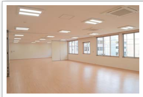
「えいらいキッズ」中の様子 木のぬくもりを感じながら過ごすことができます。→