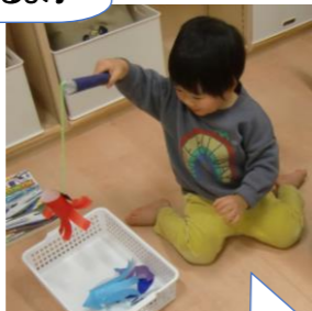
☆お魚釣り☆ たこが釣れた～♪