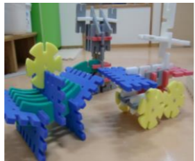
ピー♪ピー♪ 駐車場に 止まります♪