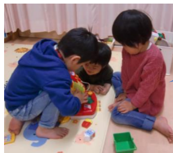
☆お買い物ごっこ☆ お兄ちゃんが お店屋さんになるよ♪

アイビーでは、お子さん一人ひとりの体調に合わせて保育を行っています。興味のある玩具に触れ、違う年齢の子どもたちとのかかわりを楽しんだり、製作に取り組むなど、心身共にゆったりと過ごせるように環境作りに努めています。