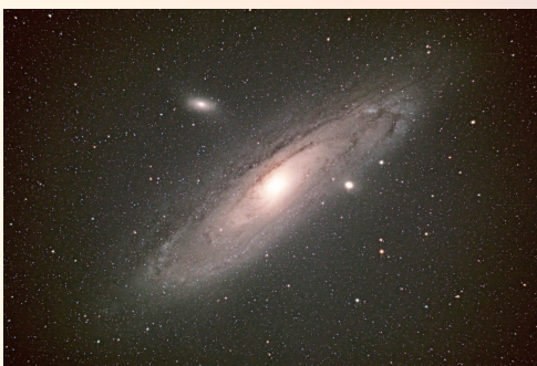
(写真・文/糖尿病・内分泌内科:仙波英徳)

これからの季節、春から夏にかけては天の川が綺麗に見える時期です。海沿いや山の中など、街の明かりが少ないところだとよく見えますので、夜のドライブもおすすめです。