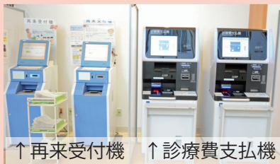
↑再来受付機 ↑診療費支払機