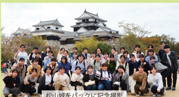
松山城をバックに記念撮影