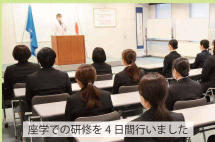
座学での研修を4日間行いました