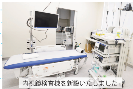
内視鏡検査棟を新設いたしました