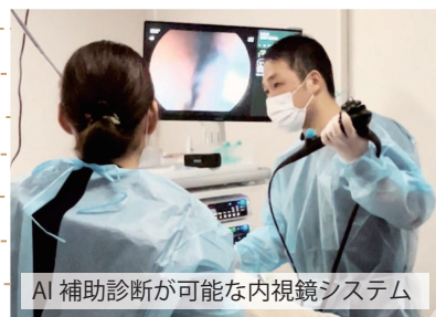
AI 補助診断が可能な内視鏡システム

また、婦人科では一般不妊治療やがん検診、月経、更年期などの婦人科疾患を診療しています。