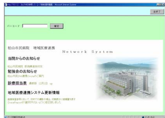
システムログイン後のホームページ