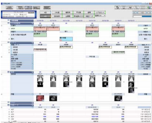
ご閲覧画像イメージ